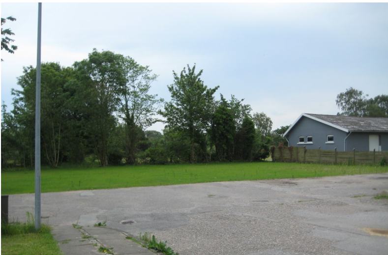
Jernbanegade 18 i Dybvad, efter nedrivning.

Er du interesseret i at høre nærmere, så kontakt mig venligst: