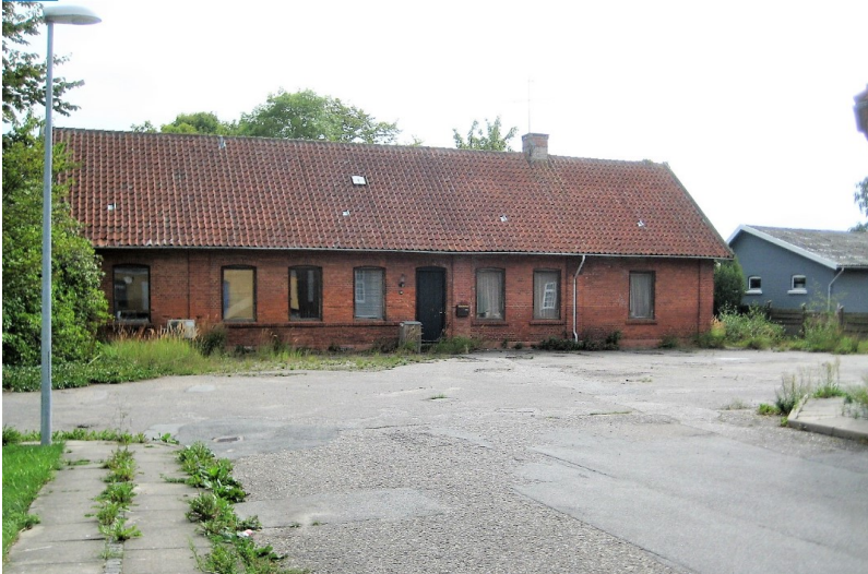
Jernbanegade 18 i Dybvad, før nedrivning.

Her kan du også se før og efter billede af allerede nedrevne bygninger.