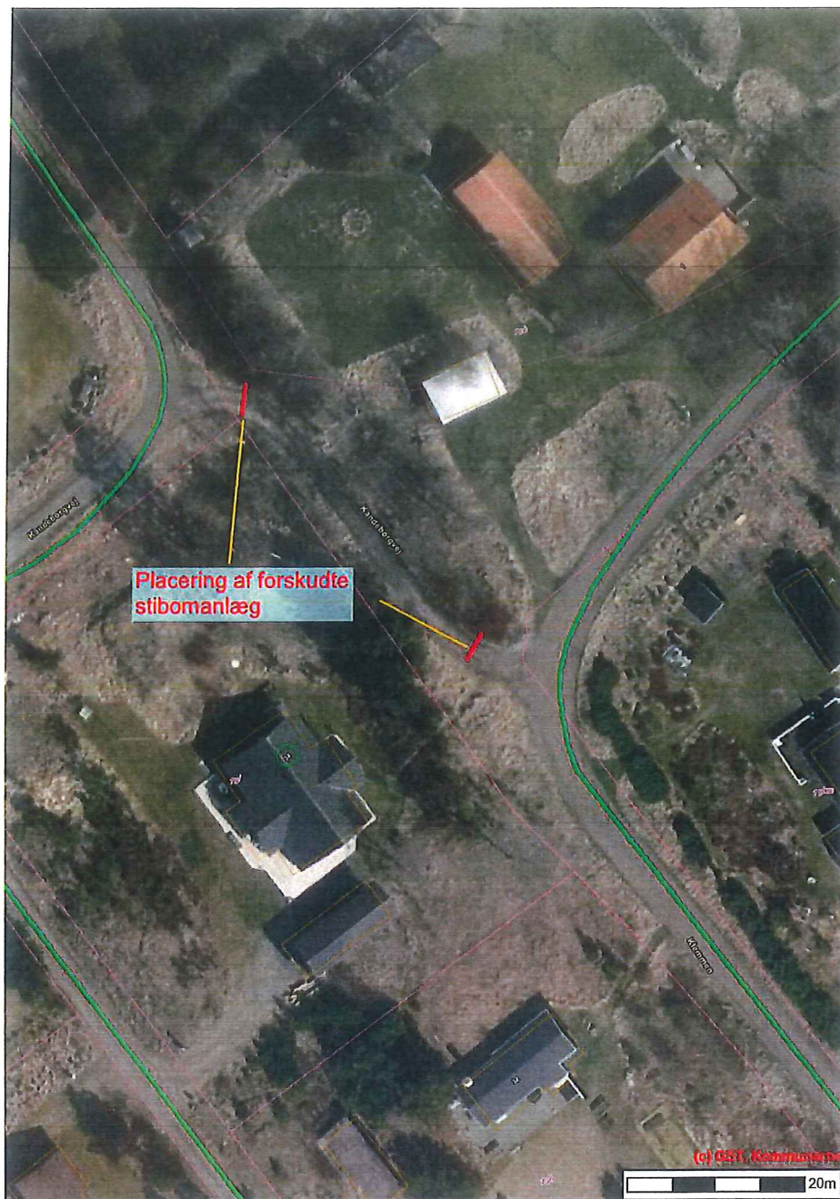
Oversigtskort visende placeringen af forskudte stibomanlæg

Uddrag fra lov om private fællesveje jf. LBK nr. 1234 af 04/11/2015)