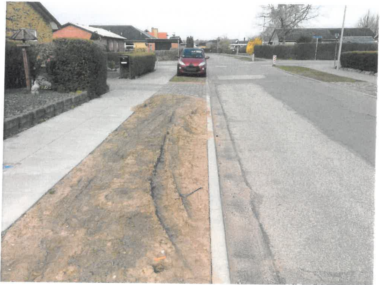
Enighedsvej, Nyrenoveret stykke hvor der ikke gives tid og ro til græsset kan få lov at etablere sig.