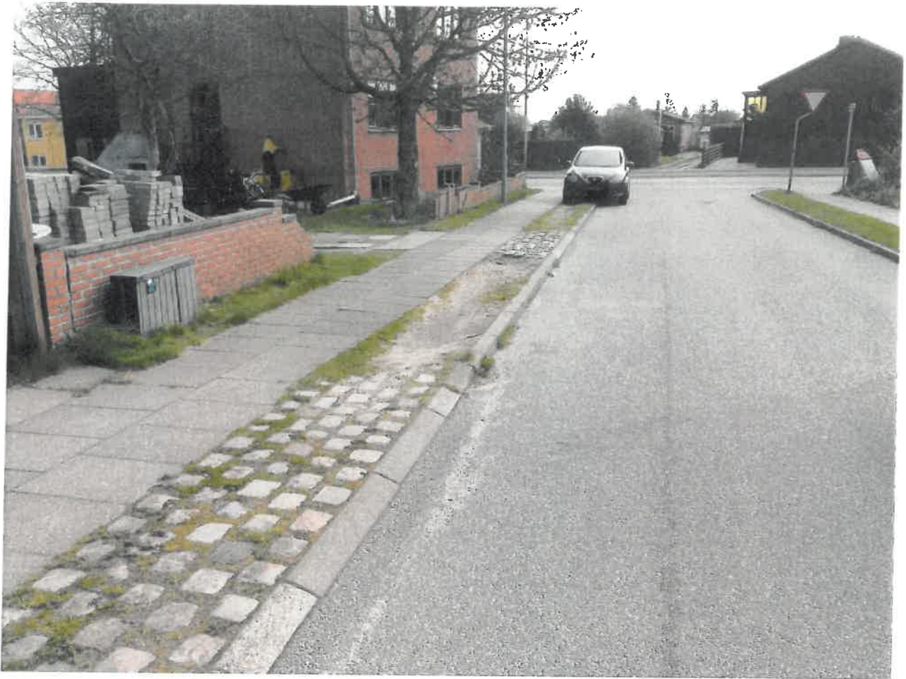
Fanøvej. Daglig parkering og kørsel i rabat hele året. Der kan ses at enkelte fortovsfliser er ”vippet” op som skyldes hjuldæk enkelte gange lige holde på kanten af fliserne.