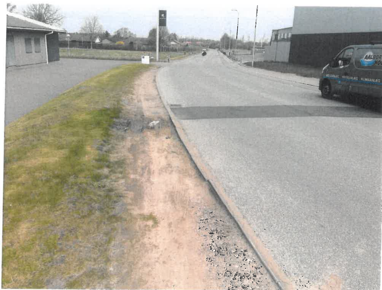
Flade Engvej, rabat opkørt og belastet så meget at også kantsten har taget skade.