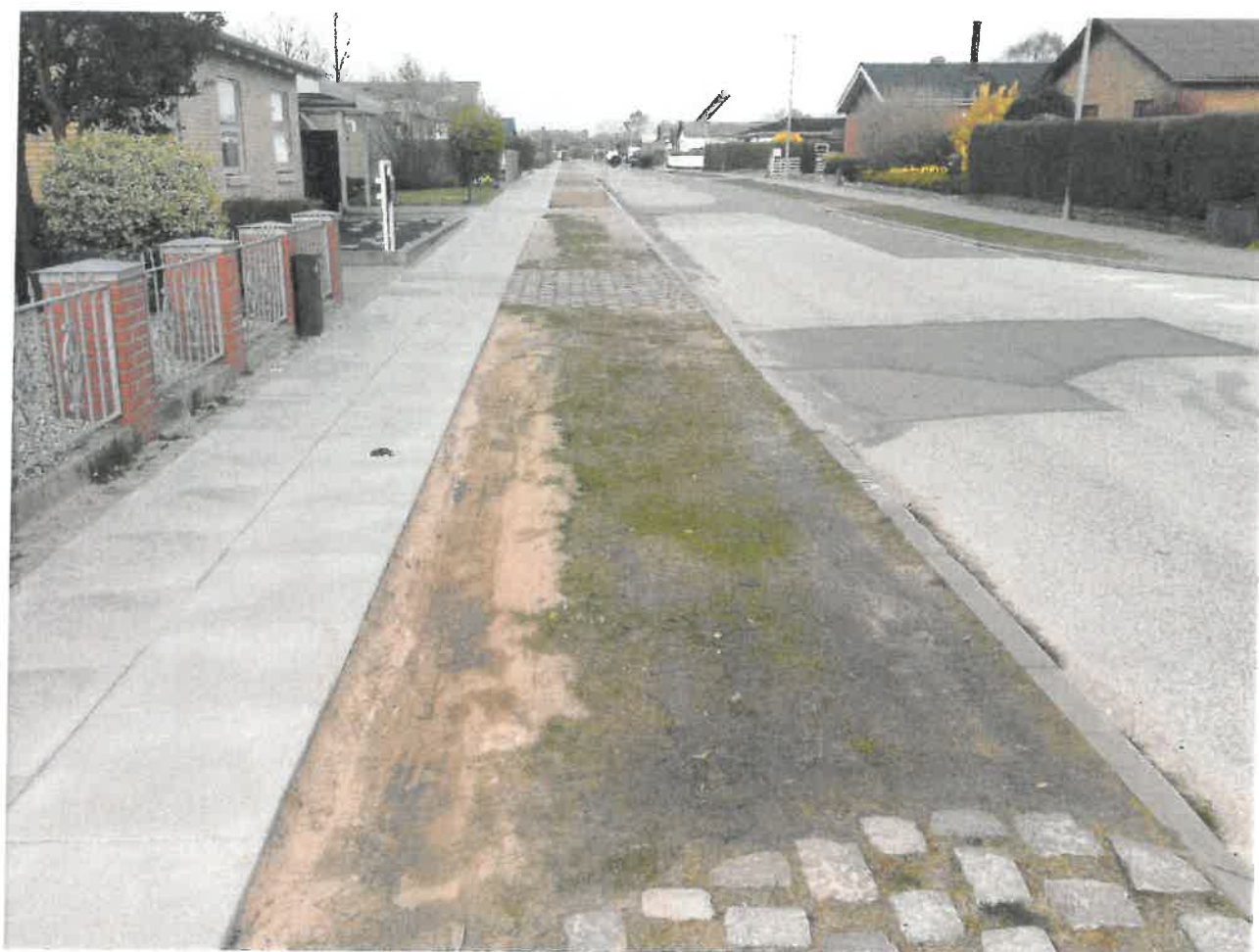
Enighedsvej, Her parkeres ofte langs fortovsfliser