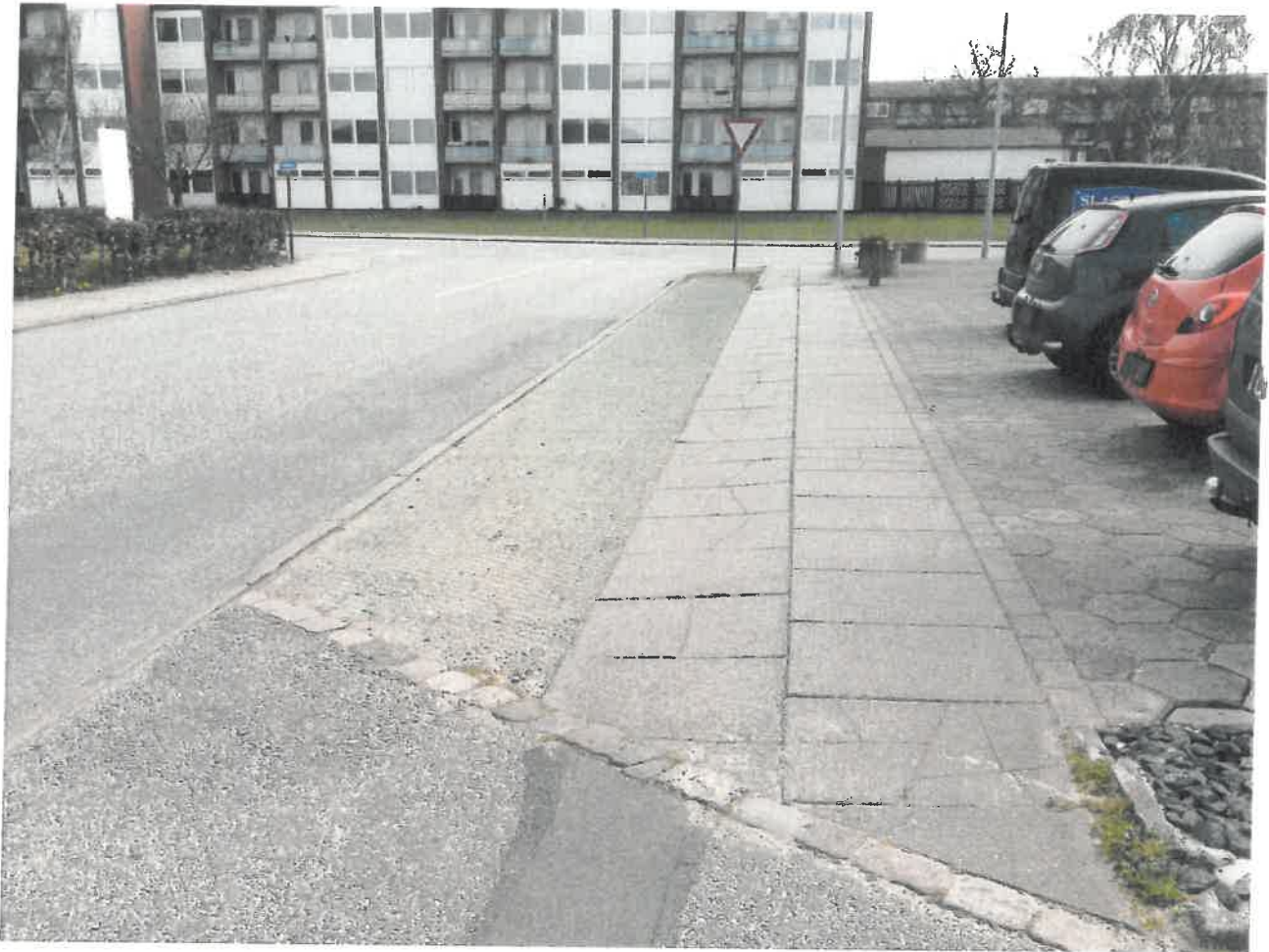
Grønlandsvej. Her er alt græs slidt af ved daglig belastning. De fleste fortovsfliser har sat sig og er knækket fordi det underliggende opbygning kun er dimensioneret til gående. Der er ikke givet nogen tilladelse til hverken overkørsel eller parkering på denne strækning.