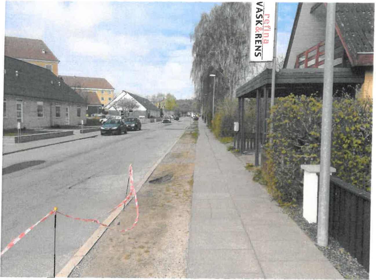
Elius Andersens Vej